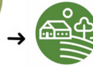
Vitaal Platteland Winterswijk